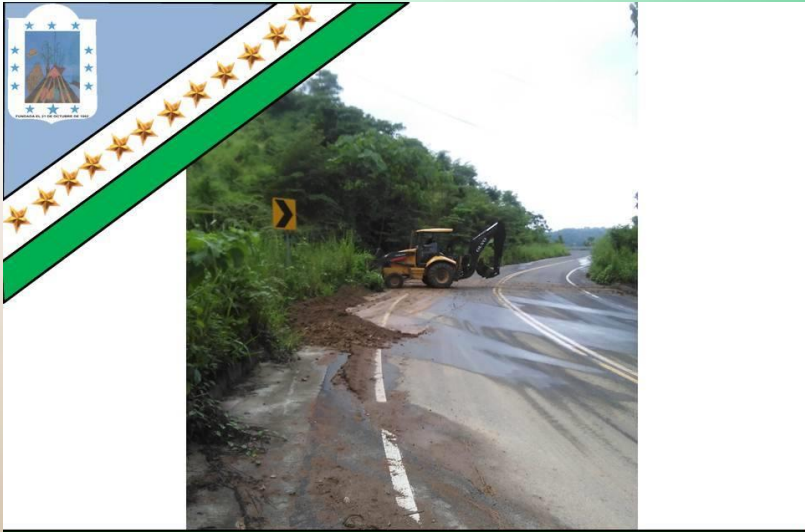
GAD Parroquial Rural Pueblo Nuevo «Trabajemos Juntos para ser Grande»