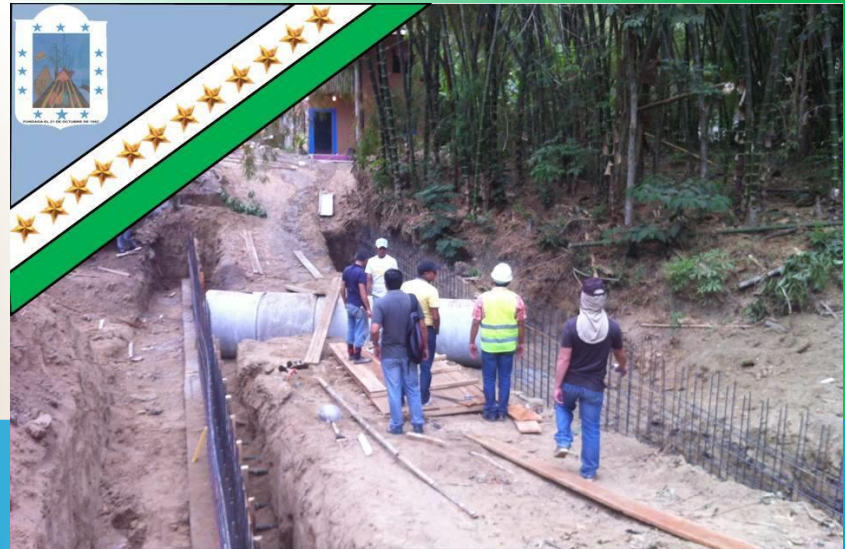
GAD Parroquial Rural Pueblo Nuevo «Trabajemos Juntos para ser Grande»