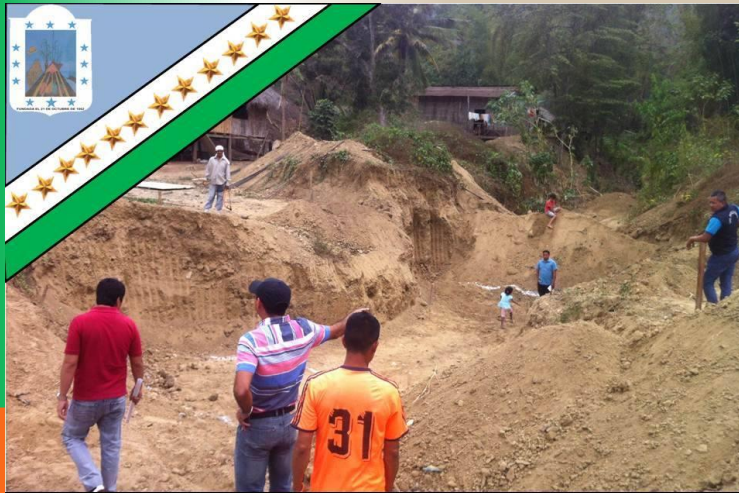
GAD Parroquial Rural Pueblo Nuevo «Trabajemos Juntos para ser Grande»