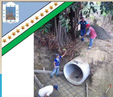
GAD Parroquial Rural Pueblo Nuevo «Trabajemos Juntos para ser Grande»