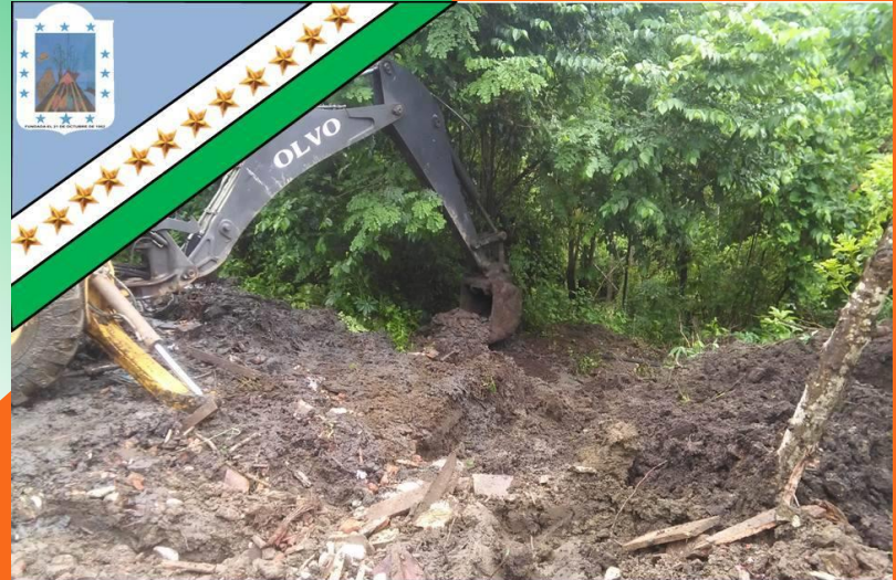
GAD Parroquial Rural Pueblo Nuevo «Trabajemos Juntos para ser Grande»