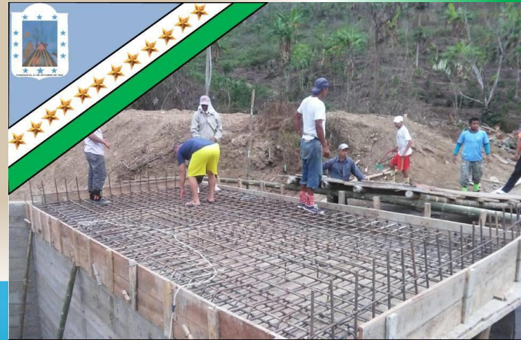
GAD Parroquial Rural Pueblo Nuevo «Trabajemos Juntos para ser Grande»