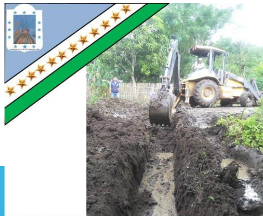
GAD Parroquial Rural Pueblo Nuevo «Trabajemos Juntos para ser Grande»