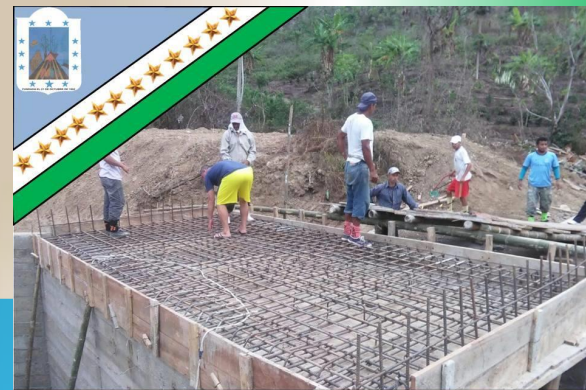
GAD Parroquial Rural Pueblo Nuevo «Trabajemos Juntos para ser Grande»