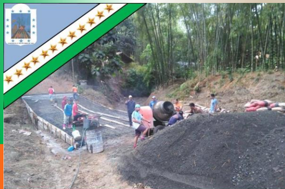
GAD Parroquial Rural Pueblo Nuevo «Trabajemos Juntos para ser Grande»