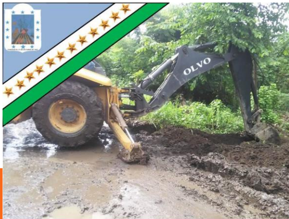
GAD Parroquial Rural Pueblo Nuevo «Trabajemos Juntos para ser Grande»