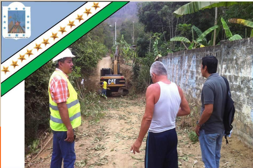
GAD Parroquial Rural Pueblo Nuevo «Trabajemos Juntos para ser Grande»