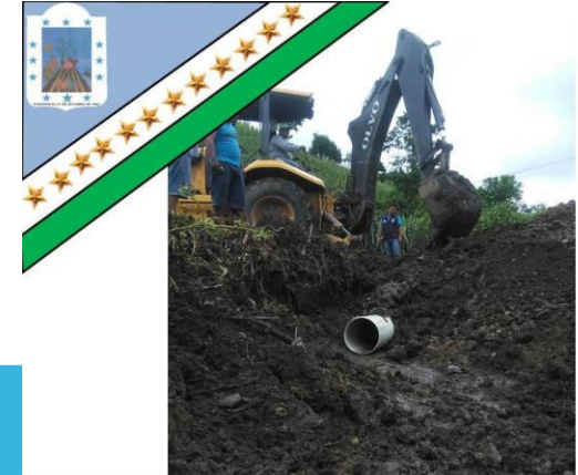
GAD Parroquial Rural Pueblo Nuevo «Trabajemos Juntos para ser Grande»