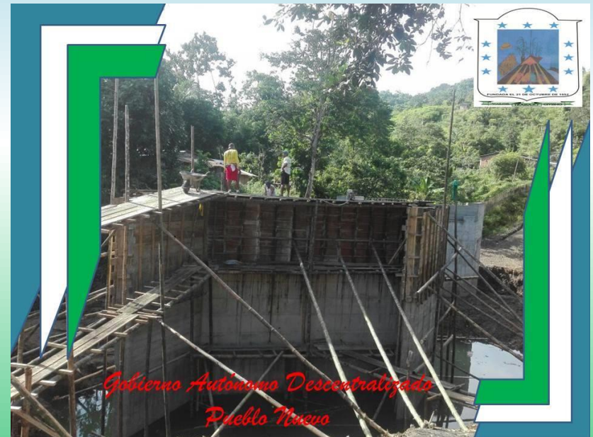
Gobierno Autónomo Descentralizado Pueblo Nuevo