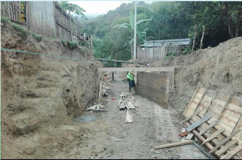
GAD PARROQUIAL PUEBLO NUEVO