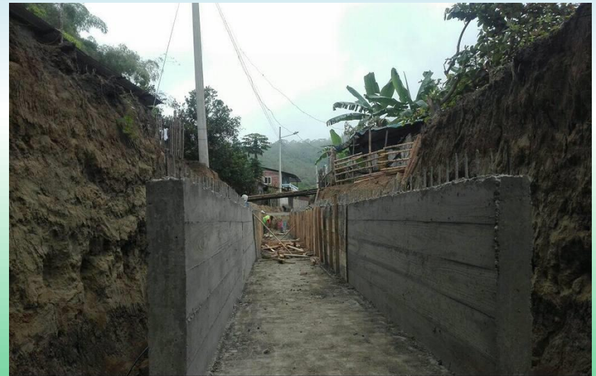
GAD PARROQUIAL PUEBLO NUEVO