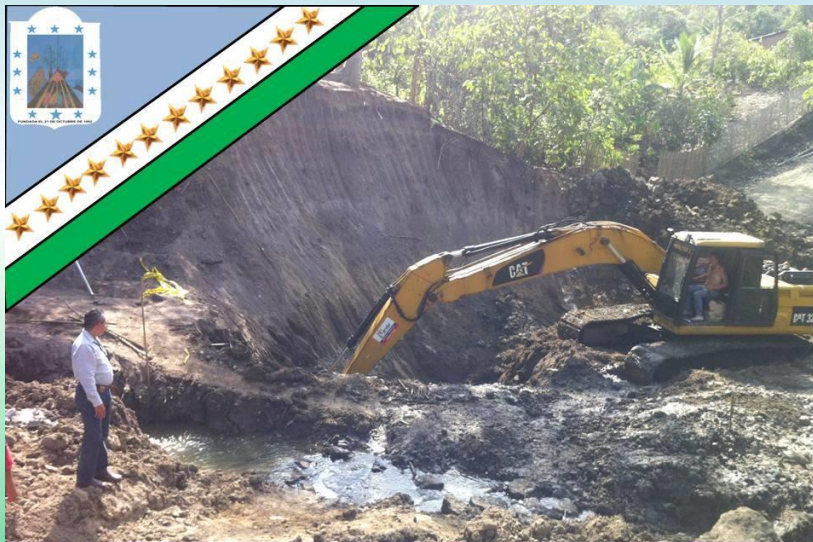
GAD Parroquial Rural Pueblo Nuevo «Trabajemos Juntos para ser Grande»