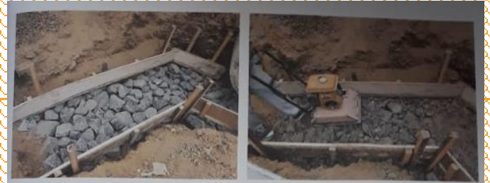
RELLENO DE PIEDRA BOLA