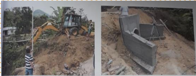
REPLANTEO Y NIVELACION- VIAL